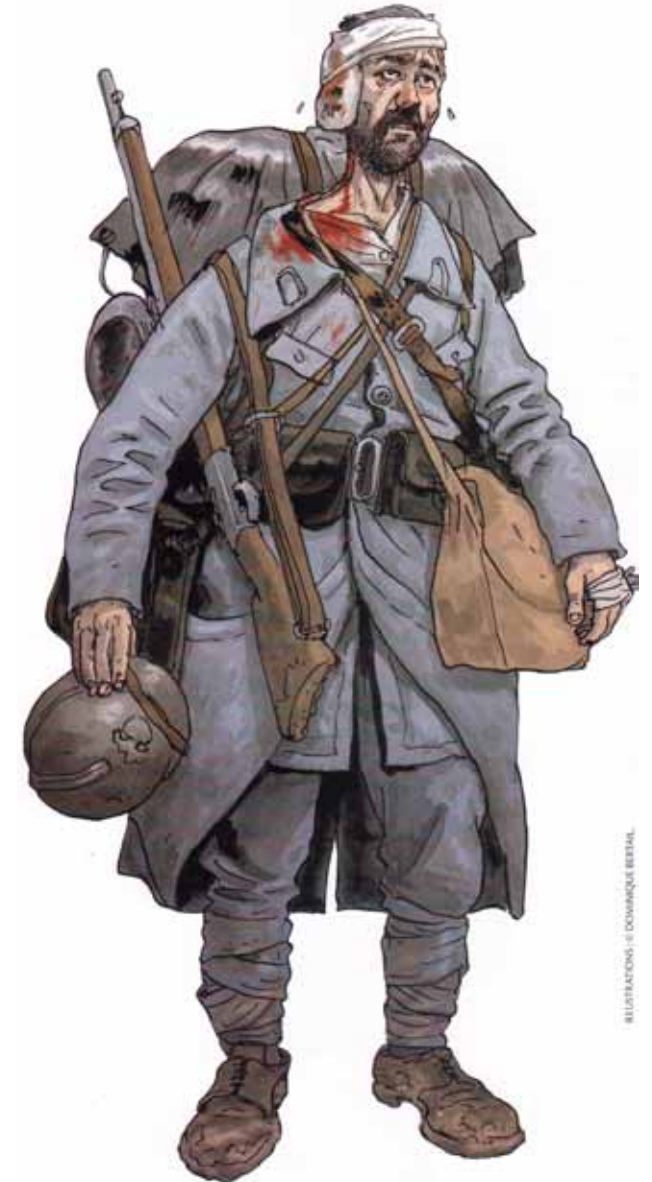
Le poilu de Verdun