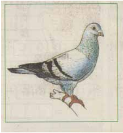
Le «vaillant», pigeon de Verdun